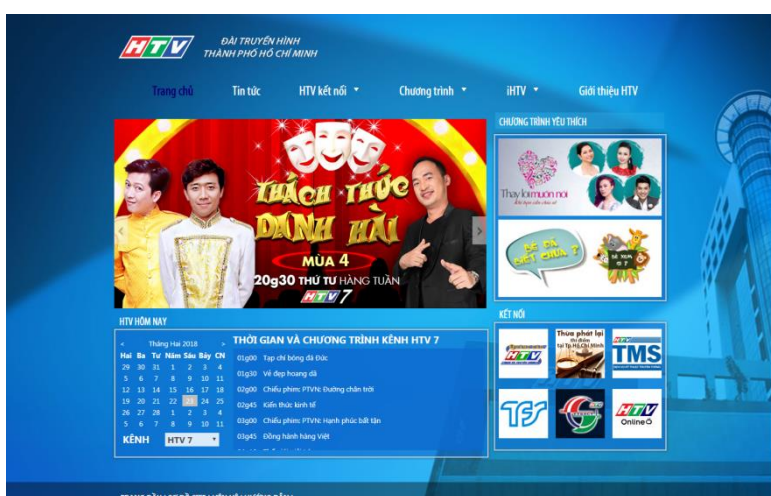
HTV 官網宣傳綜藝節目

HTV 代表回應連續劇集牽涉藝人版權，海外播出需再進行後續磋商；其他如廚藝教學、音樂綜藝、紅娘配對等節目，較偏向越南當地收視習慣，HTV 須評估是否適合臺灣市場。而無論免費平臺，或收費平臺，援例均須支付 HTV 海外版權費，若要進行免費授權或互換節目折抵版權費之類的合作，雙方可以再談。