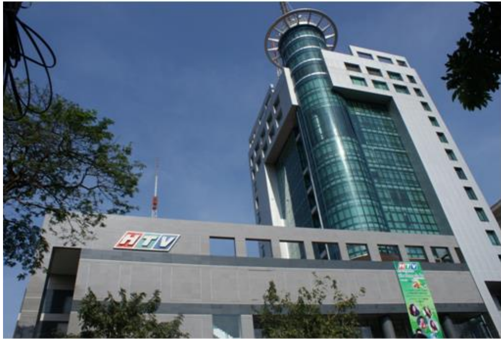
胡志明市電視臺總部

OTT TV 產業日趨發展蓬勃，透過影音串流隨選隨看的多螢趨勢早已成形。因應 OTT 帶來的衝擊與挑戰，本臺與中華電信 MOD 攜手合作，開辦印尼語、泰國語及越南語的語言教學節目，期盼順應此一潮流，帶給觀眾優質的語言學習影音平臺，也讓央廣的服務邁向外語節目影音化的新里程碑。